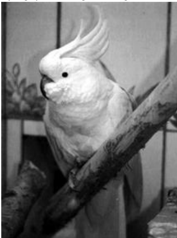
Большой желтохлтый какаду Мэтьюса.

Какаду, обитающих в Австралии, Индонезии, Новой Гвинее и на Филиппинских островах, насчитывается около 20 видов. От этих попугаев довольно трудно получить потомство в неволе, поэтому местные жители ловят птенцов какаду в их естественной среде обитания, приучают к искусственному корму, а затем продают морякам или торговцам птицами.