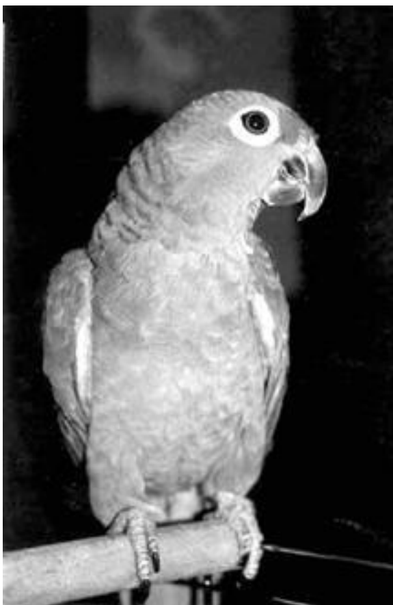
Амазон – один из самых агрессивных попугаев.

У крупных попугаев период агрессии, как правило, наступает в возрасте 5–15 лет. Птицы начинают рвать бумагу, кусаться, щипаться, кричать и т. д. Причем этот период может продолжаться у попугаев от нескольких месяцев до нескольких лет. Затем они снова становятся мирными и послушными.